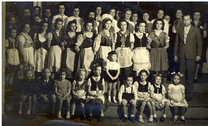
Slika 1: Aleksandrinke