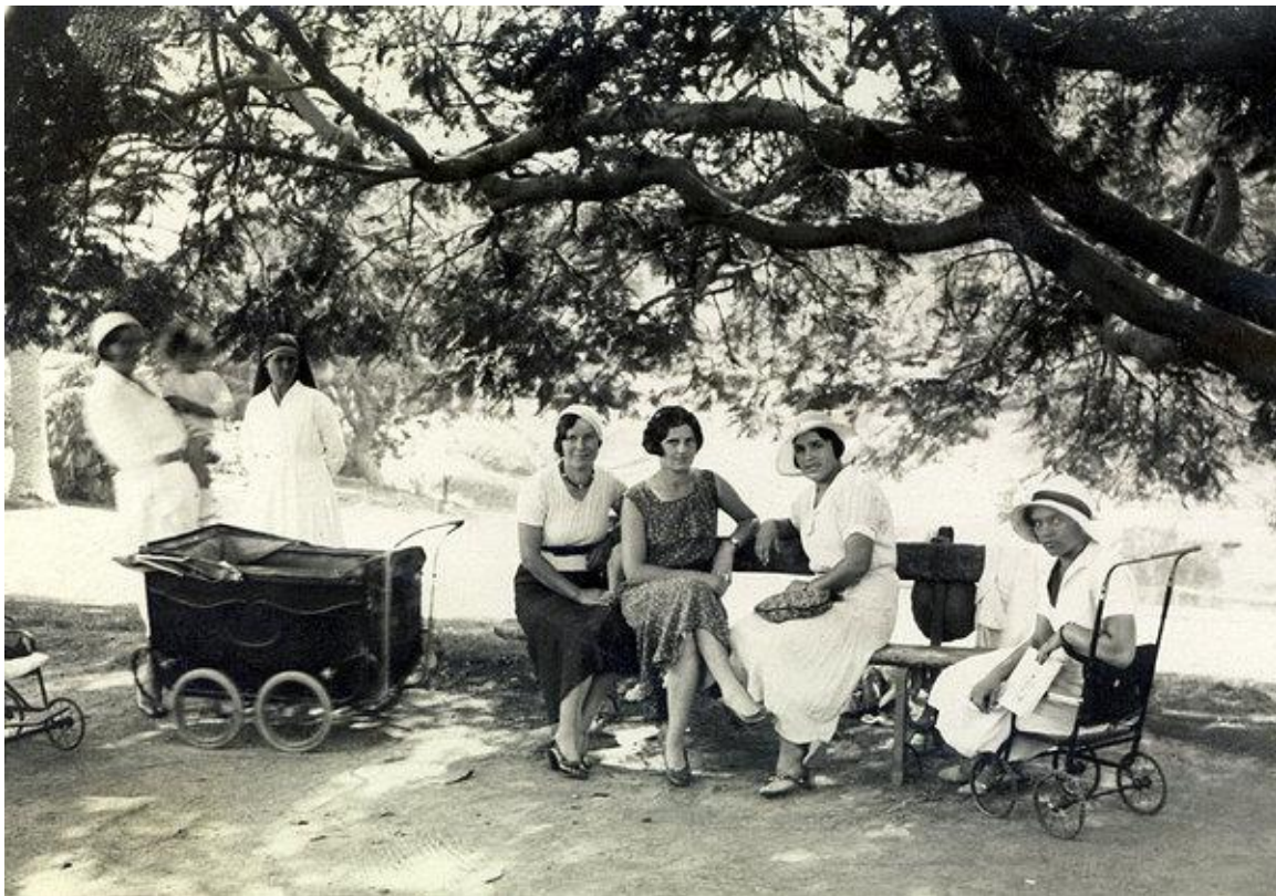
Slika 2: Aleksandrinke in njihovi varovanci

Otrok je bil deležen vse pozornosti in zelo dobrih razmer za odraščanje: glede higiene je živel v zelo čistem okolju v primerjavi z marsikaterim revnejšim egipčanskim otrokom, zato je imel tudi manj možnosti za različne okužbe, deležen je bil najboljše izobrazbe, kasneje tudi službe in socialnega položaja. Imeli so dovolj vsakovrstne hrane, kar je je Egipt tedaj lahko ponudil. Njihovi pogoji za razvoj in nenazadnje tudi za preživetje so bili torej zelo dobri