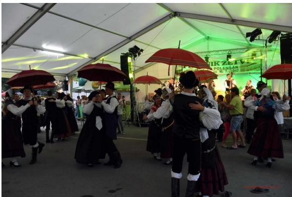
Slika 3: Plesalci plesne skupine Mladi glas in Planika na obisku v Sloveniji.

Že iz samih imen društev lahko sklepamo, s čim se ta ukvarjajo. Tako se folklorne in plesne skupine ukvarjajo z ohranjanjem slovenskih tradicionalnih plesov in posledično glasbe. Plešejo namreč na narodno-zabavno glasbo, oblečeni pa so v tradicionalne slovenske noše (slika 3). V ta društva so vključeni tudi otroci, saj ponujajo možnost učenja plesa tako mlajšim, kot tudi starejšim.