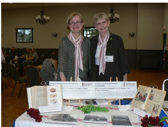
Slika 4: Predstavnici Kanadskega slovenskega zgodovinskega društva

Eno izmed pomembnih društev je Kanadsko slovensko zgodovinsko društvo (slika 4), ki skrbi za ohranjanje zgodovine Slovencev v Kanadi, prireja tematske razstave in izdaja lastno glasilo.