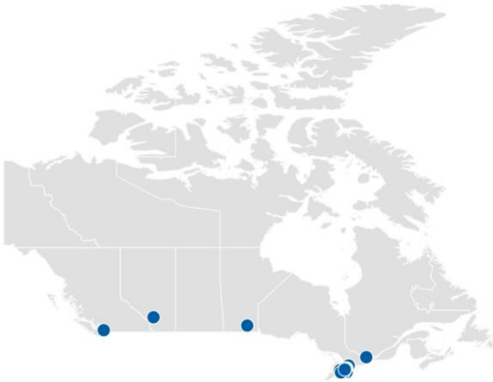
Slika 1: Lokacije slovenskih društev v Kanadi

Slovencev manjše in so zato ti organizirani v okviru posameznih društev, kot so Slovensko društvo Vancouver, Calgary in Winnipeg.